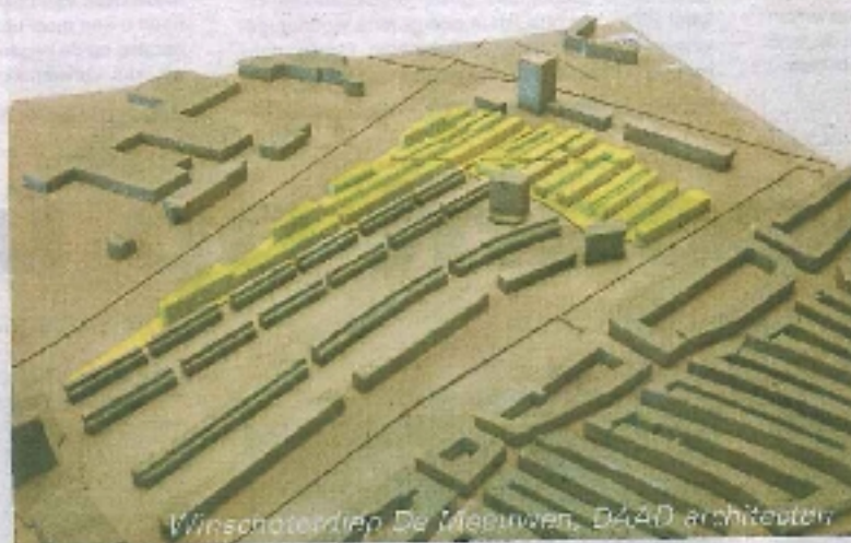
Winschoterdijk De Meeuwen, D44D architecten