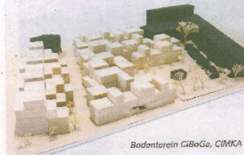
Bodenterein GiBoGa, CIMKA

moegezocht naar geschikte locaties. Dat leverde 50 ontwerpen voor 30 locaties op. De ontwerpdracht luidde: 'Ontwerp woningen met een eigen buitenruimte waarmee je ongebruikte plekken in de stad zo goed mogelijk kunt benutten.'