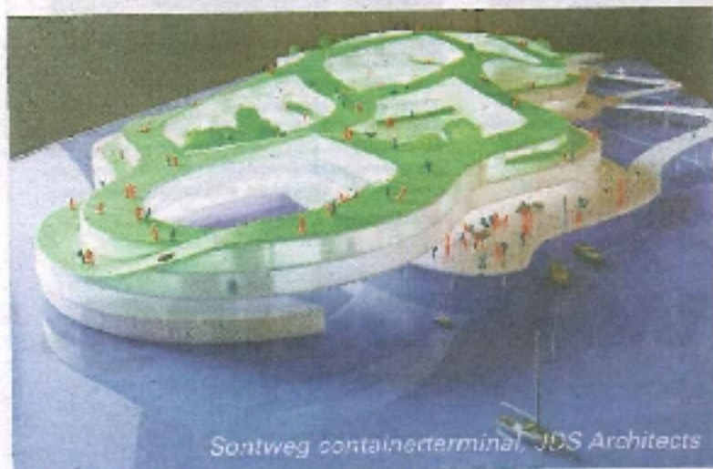
Sontweg containerterminal, JDS Architects

Intense Laagbouw is geen 21ste eeuwse uitvinding. Zo zijn de Groninger hofjes, Pelstergasthuis en Pepergasthuis middeleeuwse voorbeelden van intense laagbouw. Ook de Oosterpoortwijk, gebouwd aan het eind van de negentiende eeuw, en in de nieuwe, nog in aanbouw zijnde wijk De Linie zijn goede voorbeelden van dicht, laag en intens bouwen. Intense laagbouw staat dus in een traditie. De vijftig ontwerpen laten zien hoe Groningen haar eigen traditie kan vernieuwen. Daarnaast is de manifestatie Intense Laagbouw bedoeld om anderen te inspireren.